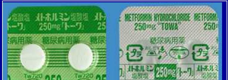
メトホルミン塩酸塩錠250mg「トーフ」