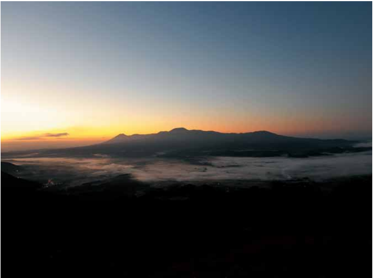
霧島山の夜明けと雲海